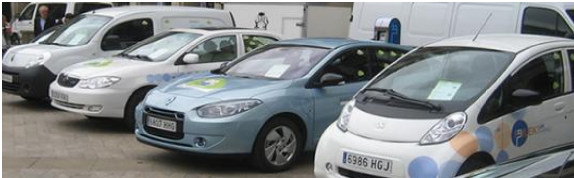
Foto: Samochody elektryczne

W Kraju Basków (Hiszpania) zostały zorganizowane mobilne Dni Energii. Impreza przenosiła się z miasta do miasta, w których na centralnych placach rozstawiano rowery oraz samochody elektryczne i hybrydowe, prowadzono szerokie działania edukacyjne skierowane do najmłodszych, poprzez gry i zabawy. Oferowano naukę energooszczędnej jazdy samochodem – tzw. eko-driving. Udostępniono punkty informacyjne.