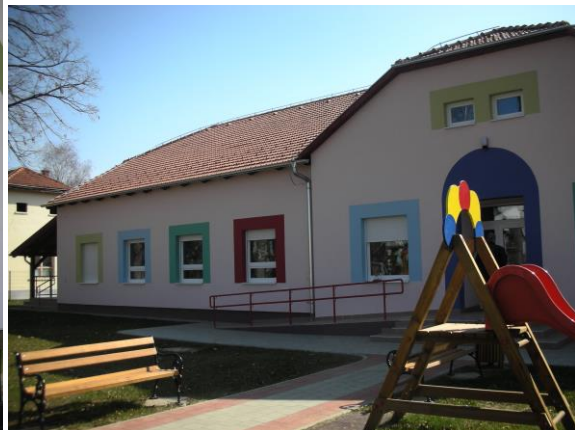
Foto: Koprivnica - przedszkole

W ramach wymiany doświadczeń koledzy z regionalnej agencji energetycznej zaprezentowali inwestycje w nowoczesnym, niskoenergetycznym wielorodzinnym budownictwie mieszkaniowym oraz adaptację byłych budynków koszarowych na potrzeby przedszkola. W trakcie adaptacji obiektu wykonano jego pełną termomodernizację i zastosowano odnawialne źródła energii.