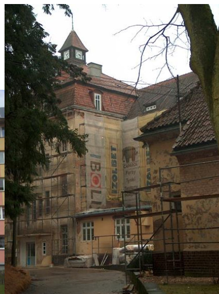
Olsztyn – termomodernizacja szpitala

Wylączna odpowiedzialność za treść niniejszej publikacji leży po stronie jej autorów. Publikacje nie odzwierciedlają opinii Wspólnot Europejskich. Komisja Europejska nie jest odpowiedzialna za jakiegokolwiek wykorzystanie informacji w nich zawartych.