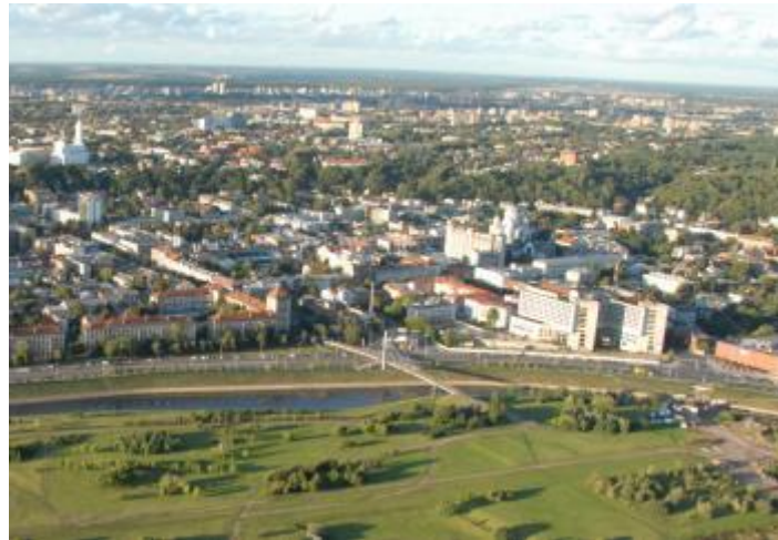
Foto: Widok z powietrza na Kowno © Liudvikas Rimantas ŽIEMYS, Fotograf z Litewskiego Instytutu ds. Energii (LEI).

Obwód Kowieński jest położony w centralnej części Litwy i jako jedyny z dziesięciu obwodów nie graniczy z żadnym innym państwem. W regionalnym oraz gminnych planach rozwoju nie ma szczególnego nacisku na działania z zakresu energii, choć sektor energii jest jednym z najważniejszych w całym systemie samorządności publicznej, jako że wydatki na energię mają znaczący udział w całości kosztów ponoszonych przez sektor publiczny i gospodarstwa domowe. W chwili obecnej z całego obwodu jedynie Gmina Miejska Kowno jest członkiem Porozumienia Burmistrzów i opracowała Plan Działań na rzecz Zrównoważonej Energii.