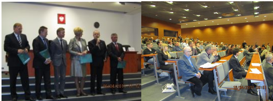
Foto: Nowi Członkowie Porozumienia między Burmistrzami i uczestnicy Dni Energii (15.05.2011)

Na Pomorzu w dniach 15-17 kwietnia 2011 odbyły się pierwsze Dni Energii. W ramach Dni Energii odbyły się prezentacje, dyskusje a także zorganizowano stanowiska wystawienniczo-informacyjne. Dniom Energii towarzyszyła podpisanie deklaracji przez pięć pierwszych gmin województwa pomorskiego o przystąpieniu do Porozumienia między Burmistrzami (Covenant of Mayors, w skrócie CoM). Do CoM przystąpiły: Gdynia, Gniewino, Hel, Kościerzyna i Władysławowo, Gminy te przyjęły na siebie zobowiązanie do opracowania Planu działania na rzecz zrównoważonego rozwoju w sektorze energii, w ciągu najbliższego roku.