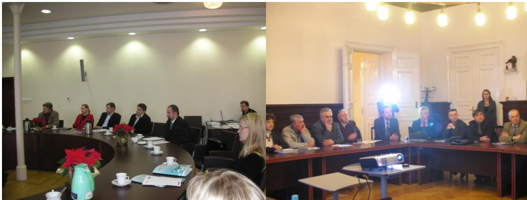
Photo: Seminar in Kwidzyn Province (21.12.2010)

Ogółem odbyło się 5 seminariów, w których udział wzięli przedstawiciele samorządów lokalnych, przedsiębiorcy oraz użytkownicy końcowi energii. Ogółem w seminariach uczestniczyło około 100 osób.